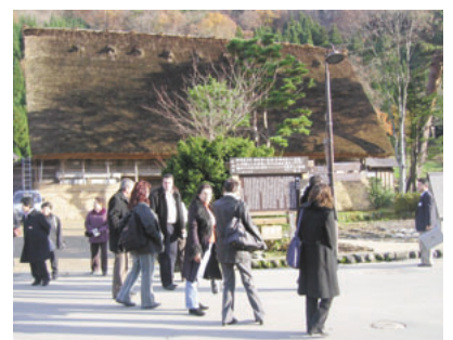
岐阜県白川村での現地視察

ブルガリアへ帰国後も研修生は相互に連絡をとりあい、それぞれの地域の実情などについて情報交換を行いながら、アクションプランの実現に向けて取り組んでおり、日本での研修で得た知識・知見を自分の内面だけに留めることなく、職場の上司・同僚などと共有し、地域の発展に貢献しています。