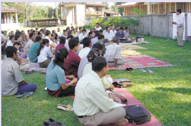
農村での計画実習 (第7回研修)

研修生の作成したアクションプランでは、この研修で習得した知識とスキルを更に広めることが提案されました。研修生の所管する県が行ってきた研修では、研修対象者の不適切な選考、研修期間やOJTの不足、効果的に知識を共有する能力の不足、女性の参加不足、インフラの欠如、村からの研修協力者の動員が不十分などの理由で、上手く行かなかった経験があります。今回作成されたアクションプランでは、今後新たに県が企画する研修でこうした弱点を克服することが盛り込まれました。