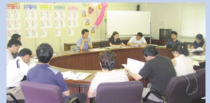
三重県伊賀市での現地視察

「日本の総合計画から学ぶこと」「自律、創意工夫、協力による開発」など、講義・視察で学んだ内容を生かしたスタディレポートを作成しました。この研修を通じて得たものを今後の施策に反映させ、中国の西部地区における均衡ある発展と持続可能な開発の促進に役立てることが期待されます。