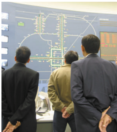
名古屋市内での現地視察

UNCARDIは、独立行政法人国際協力機構 (JICA) と共催で、環境保全型交通体系 (EST) などの交通政策を通じた都市環境の改善を目的として、標記研修コース (全5回) を実施しています。第2回となる今回の研修には、ボスニア・ヘルツェゴビナ、カンボジア、チリ、中国、インド、キルギスタン、ネパール、ベネズエラから都市環境と交通に関わる行政官8名が参加し、大気環境管理、排気規制、車検、燃料品質、騒音規制、土地利用、人間と環境に優しい都市交通インフラ、交通安全などに関わるさまざまな課題を対象とした都市環境と交通についての講義、演習、日本や諸外国の事例を使つての事例発表、名古屋市や東京都などの行政機構、自動車製造工場、警察、