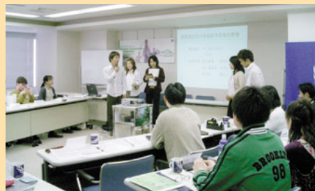
第4回UNCRDスタディキャンプ