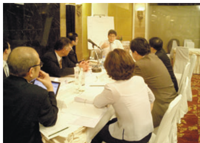
グループ討議の様様

UNCRDは国連開発計画・アジア太平洋開発情報プログラム (UNDP-APDIP) と共同で「アジア太平洋地域における電子政府推進のための能力向上」プロジェクトを実施しています。このプロジェクトは、人間の安全保障や利害関係者の参画の重要性