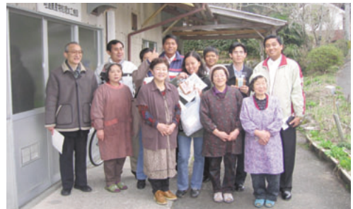
大分県での現地視察

この研修の成果を活かし、人間の安全保障の理念が取り込まれたプロジェクトが形成され、地域開発が進められることが期待されます。