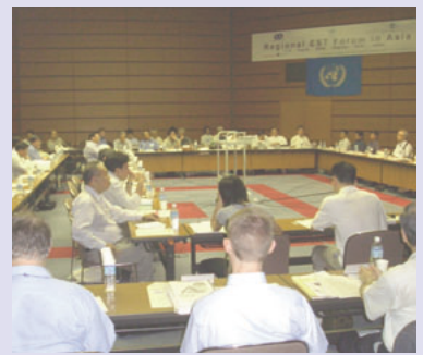
フォーラムの様相