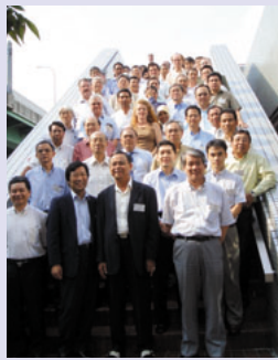
フォーラム参加者

(BRT)に関するサイドイベントなどが行われました。最後にアジアにおけるESTの促進を提唱する「愛知宣言」が参加国により採択され、フォーラムが正式に発足し、ESTの推進に向けた協力体制が構築されました。