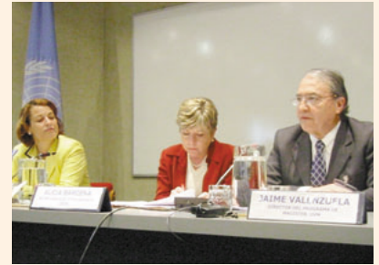
ワークショップの様相

ける人間の安全保障に焦点をあてた枠組についての分析、(2) 人間の安全保障の概念における主要な点と持続的発展、人間開発、人権、生活の質など他の概念との比較、(3) 人間の安全保障に関する指標、(4) 人間の安全保障に基づく理論的枠組みの新たな開発などについて議論を繰り広げました。