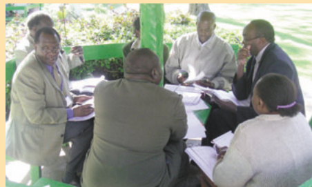
ケニア計画策定実施研修ワークショップグループ討議