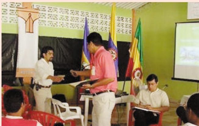
自治体ワークショップの様相

プロジェクトの実施にあたり、各自治体、地方組織の参画を得るための支援として、UNCRDラテンアメリカ事務所は、2006年2月にビレタ、パチョ、ファカナチバ、ソアチャ、ジラド、ボゴタ市の6カ所においてワークショップを開催しました。ワークショッ