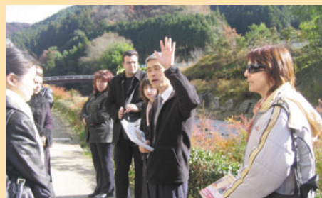
第3回ブルガリア地域住民主導による地域振興の手法研修コース 豊田市足助町での現地視察