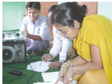
コミュニティセンター(ネパール)における会合の様様

このプロジェクトの過程で活用している参加型手法により、現地のコミュニティにおいて、災害時だけでなく普段から、自分や家族の命、地域住民の命が守られるよう、様々なパートナーとともに、知識・経験を共有しながら協力することを追求しています。