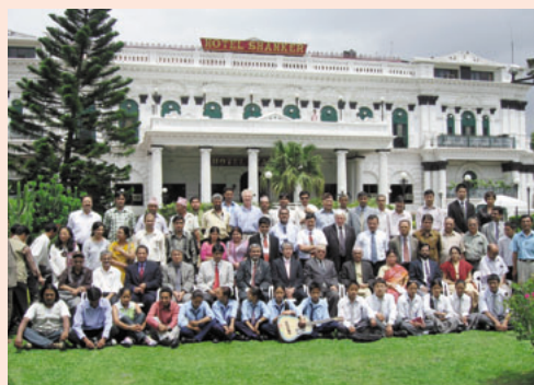
ワークショップ参加者

開始するよう、政府レベルに働きかけを行うことのほか、技術面、防災教育面や能力開発に関係する6項目の課題をまとめました。