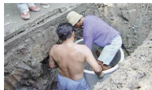
タンク取り付け作業

このプロジェクトでは運搬・設置などの作業は住民の手によって進められ、定期的な処理剤の投入などの設