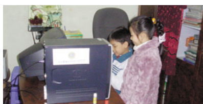
寄贈されたパソコンを使う児童

名古屋東山ライオンズクラブとライオンズ国際財団は、2005年7月の信号機設置に続き、2005年9月にベトナム・ハノイ市キム・リエン小学校にテレビ、パソコン、プリンターを寄贈しました。