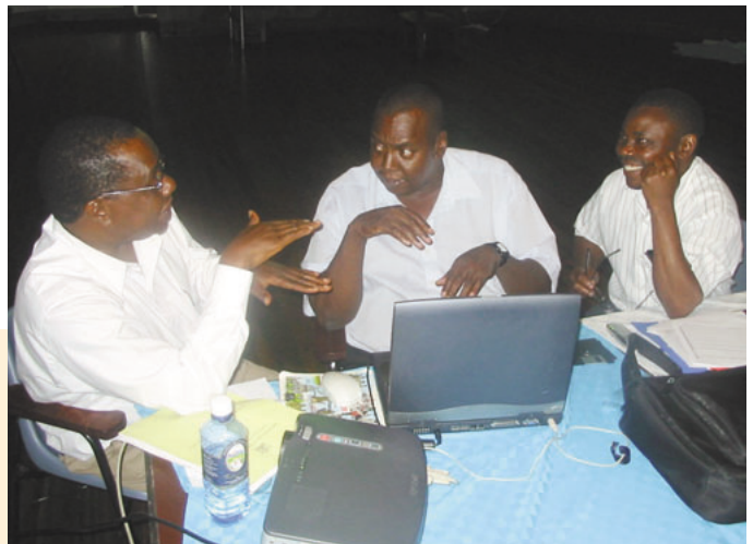
グループ討議の模様