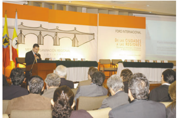
国際フォーラムの様相

UNCRDラテンアメリカ事務所、RPBから「都市から地方へ-ボゴタ・クンディナマルカにおける総合的領域開発」というテーマで、地域開発の経験やそこから学んだことについての発表があり、ボゴタ・クンディナマルカのプロジェクト5年間の経緯についての20分間の映像が公開されました。