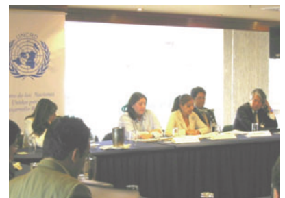
ワークショップの様相

ジェクト始動に向け、意思決定チームおよび作業チームの構成とその権限や予算状況などの3点でした。