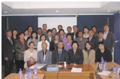
モンゴルでのフォローアップセミナー参加者

モンゴルでは1992年に市場主義経済へ移行して以来、急速な都市化が進んでいます。特に首都ウランバートル市では、農村部からの人口流入が加速度的に続いており、現在では国の人口の約半数が首都に集中しています。こうした事態にもかかわらず、