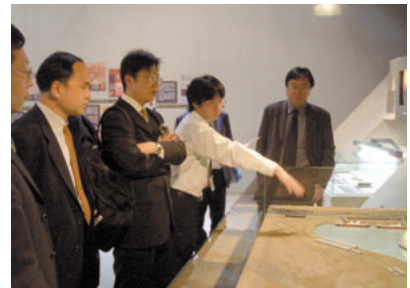
福岡県大牟田市での現地視察

市町村それぞれのレベルでの国土計画や地域開発計画について学ぶことにより、関係団体や地域住民との協力の必要性について理解を深めることができました。日本の様々な経験が中国での今後の国土計画や地域開発施策へ活かされることが期待されます。