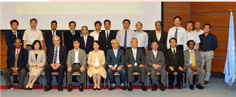
専門家会合参加者