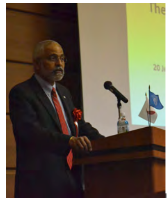
公開シンポジウム「UNCRD がつなぐ世界の知恵、中部の 知恵、持続可能で強靱なまち づくり」