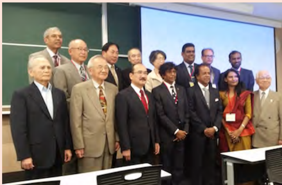
フォーラムの様相

同フォーラムの共催に UNCRD が参画したことにより、名城大学の方々に対して、UNCRD が推進しているアジア地域の持続可能な開発に欠かせない統合的地域開発、EST および 3R (廃棄物管理および資源効率性を通じた循環型社会の構築) の活動を紹介し、アジアの地域開発への関心を高めることができました。