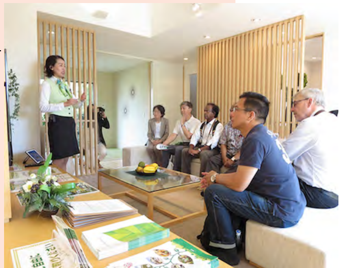
スマートハウス内で説明を受ける参加者

まずは中核施設のパビリオンで、「とよたエコフルタウン」の概要説明を受けました。次に、超小型電気自動車などの貸出拠点となっているスマートモビリティパーク、HEMS（ホーム・エネルギー・マネジメント・システム）や、太陽光発電、蓄電設備を兼ね備えたスマートハウスを見学しました。続いて、燃料電池自動車に水素を供給する水素ステーションへ移動、製造・貯蔵設備を見学し、水素製造の過程や燃料電池自動車などについての説明を受けました。また、燃料電池自動車「MIRAI」や立ち乗り型乗り物「winglet」