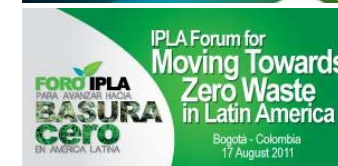
左: 2013 年 1 月に UNCRD およびゼロウェイスト・サウスオーストラリアの支援の下でインド・アーマダバード地方自治体が策定した「アーマダバード市のゼロ・ウェイストに向けたロードマップ」 右上: IPLA の初開催の国際フォーラム(2011 年 10 月 17-18 日、韓国・大邱市) 右下: ゼロ・ウェイストに関する IPLA ラテンアメリカ・フォーラム(2011 年 8 月 17 日、コロンビア・ボゴタ市)