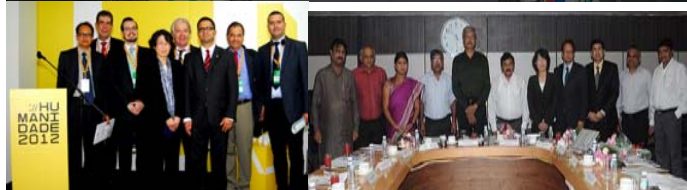
上: IPLA 国際フォーラム「グリーン経済に向けたゼロ・ウェイストの取組み～地方自治体の役割」(2011 年 10 月 17-18 日、韓国・大邱市、韓国環境省および UNCRD 共催) 左下: リオ+20 における IPLA サイドイベント「持続可能な都市へ向けたゼロ・ウェイスト政策と行動」(2012 年 6 月 19 日、ブラジル・リオデジャネイロ市) 右下: 「アーマダバード市のゼロ・ウェイストに向けたロードマップ」の策定に関する関係者協議会 (2012 年 9 月 11-12 日、インド・アーマダバード市)