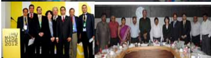
Сверху: Инаугурационный Глобальный форум IPLA по переходу к Нулевым Отходам для Зеленой Экономики Роль Местных Властей, Дагу, Республика Корея, 17-18 октября 2011 г. Слева снизу: Мероприятие IPLA в ходе Rio+20 по Стратегиям Нулевых Отходов и Действиям для создания Устойчивых Городов, Рио-де-Жанейро, Бразилия, 19 Июня 2012 г. Справа снизу: Мультисторонняя консультационная встреча касательно Продвижения к Нулевым Отходам в Ахмедабаде, Ахмедабад, Индия, 11-12 Сентября 2012 г.